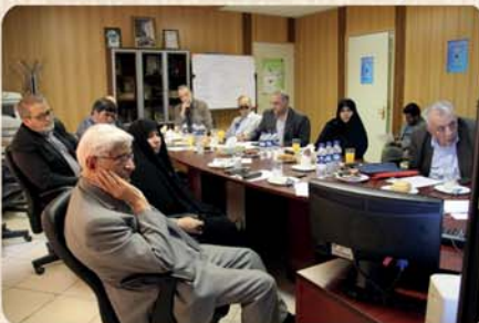
حرکت در مسیر سرمایه‌گذاری اقتصادی از برنامه‌های پیش روی دفتر ارتباط با دانش آموختگان