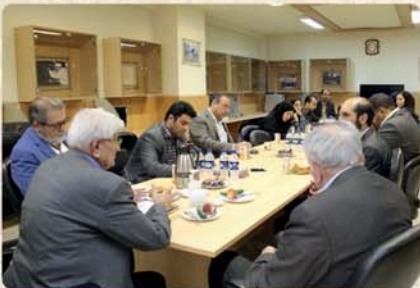
برگزاری جلسه خرداد ماه با تاکید بر جذب منابع مالی خارج از دانشگاه